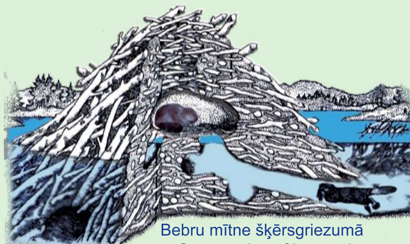
Bebru mītne šķērsgrīzumā Cross section of beaver house

Galvenie ienaidnieki – vilks, lūsis, mazuļus apdraud arī lapsa, jenotsuns un ūdrs.