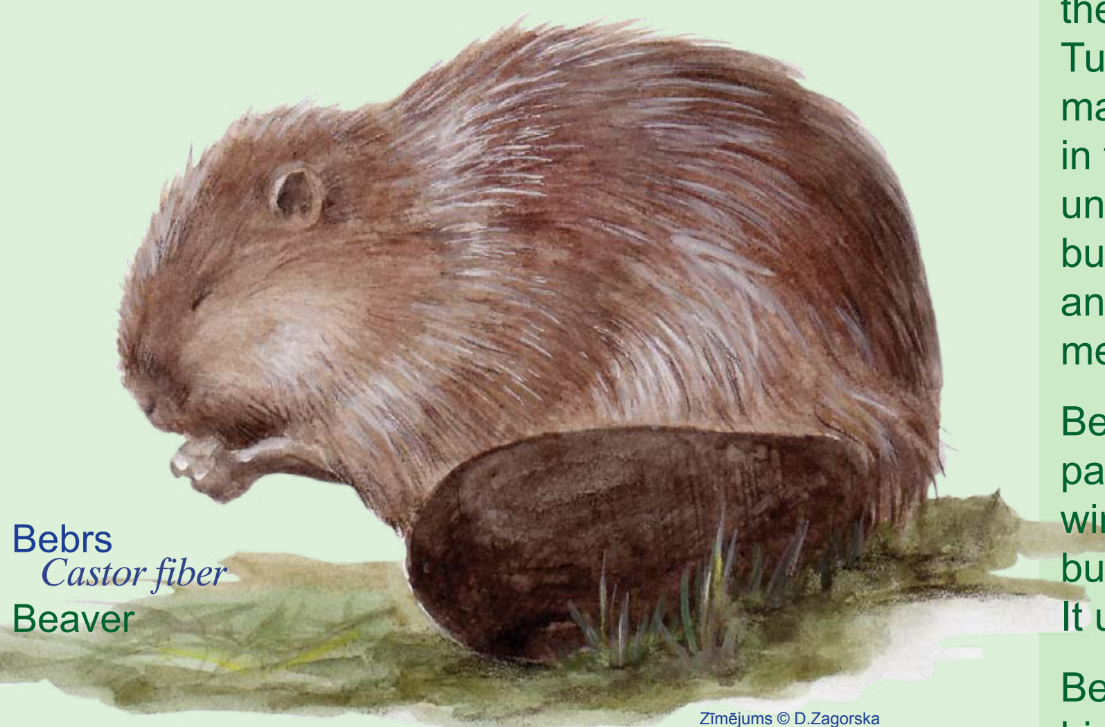
Bebrs Castor fiber Beaver